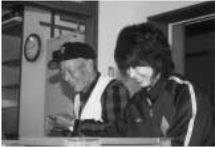
▲笑顔あふれる作業場です

わたむきの里作業所では、利用者の皆さんと一緒に電球を入れる箱の組み立てや、古くなった衣服などを雑巾（ウェス）にする作業をしていました。普段は接する機会のない人たちとコミュニケーションをとり、楽しみながら作業に取り組んでいました。