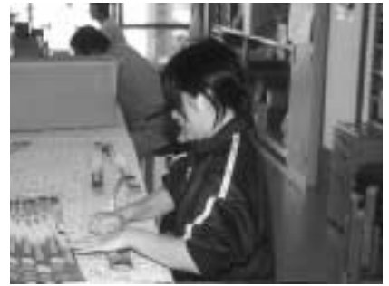
▲箱の組み立て作業