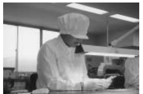
▲流れ作業にも参加しました