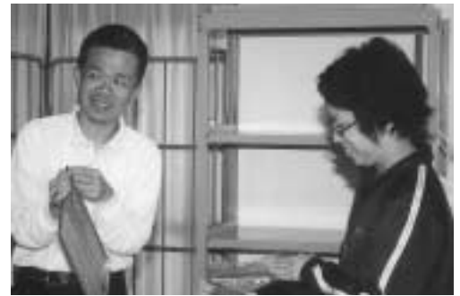
▲楽しく作業しています