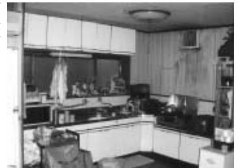
Aさん宅の台所：リフォーム前