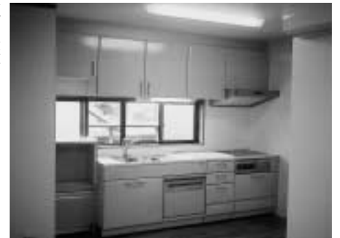
Aさん宅の台所：リフォーム後