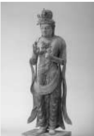
▶木造聖観音立像（金剛定寺）

この一木造の技法を用いて造像された日野町内の代表作が金剛定寺（中山）の木造聖観音立像です。一木造の丸彫りに近い技法、奥行きのある立体的な造形など、平安