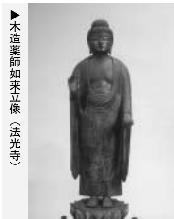
▶木造薬師如来立像（法光寺）

本様」として模範となり、都だけでなく、地方にも広く普及しました。日野町内において、定朝様の影響を受けた作例が登場するようになるのは、11世紀後半から12世紀ころになります。これらの中で、最も大きく、古様をあらわしているのが安楽寺（下駒月）の木造阿彌陀如来坐像で、11世紀後半の作とみられています。割矧の技法・繊細な衣文表現など、定朝様の様式にのっとった秀作として貴重です。