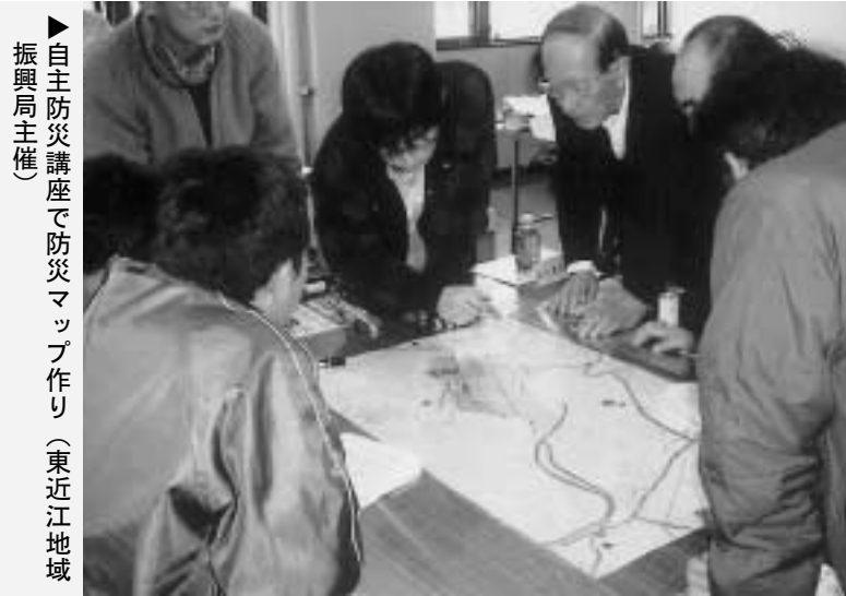
▶自主防災講座で防災マップ作り(東近江地域振興局主催)