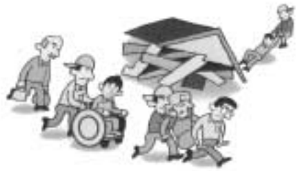
いざというとき、助け合える