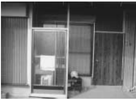
Aさん宅の外回り：リフォーム後