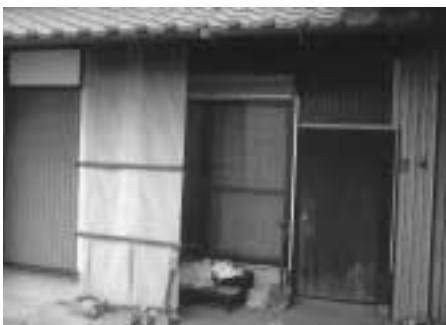
Aさん宅の外回り：リフォーム前