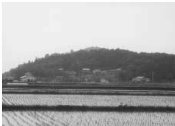
▲中之郷から佐久良城方向を望む

この城の特色は、まず城の構築に際し大掛かりな土木工事を行っていることです。たとえば城の中心となる部分は、東西約五五メー