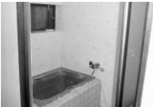
Aさん宅のお風呂：リフォーム前