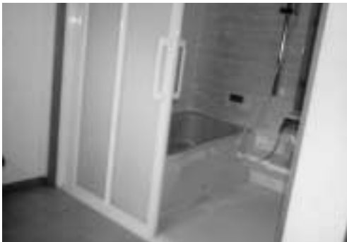
Aさん宅のお風呂：リフォーム後