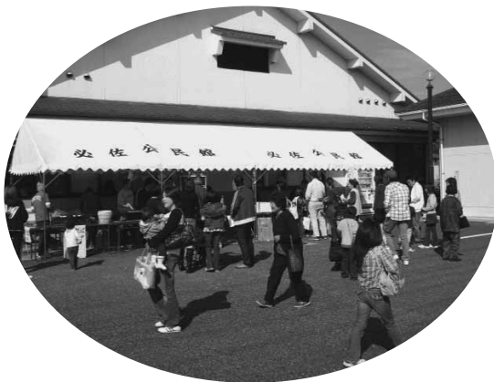
▲必佐公民館での文化祭