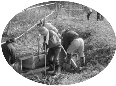
▲農地・水・環境保全 向上対策