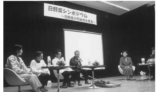
▲日野菜シンポジウム