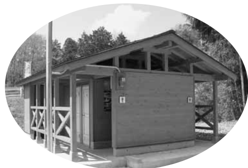
▲綿向山登山口公衆トイレ