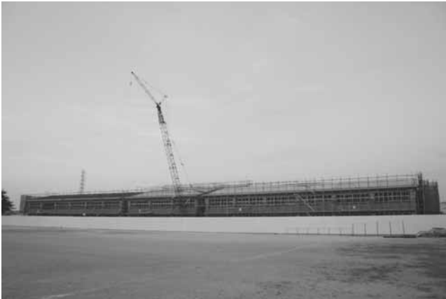
▲建設の進む日野中学校