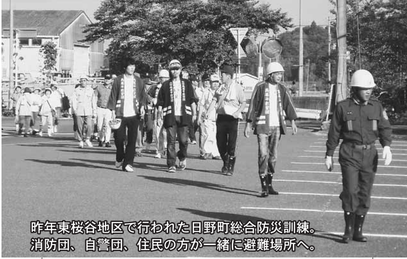
昨年東桜谷地区で行われた日野町総合防災訓練。消防団、自警団、住民の方が一緒に避難場所へ。