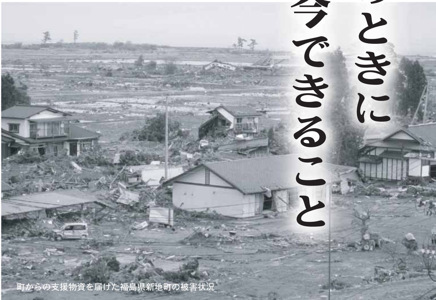
町からの支援物資を届けた福島県新地町の被害状況

政府、地方公共団体などの防災関係諸機関をはじめ、広く国民の一人ひとりが台風、豪雨、洪水、高潮、地震、津波などの災害についての認識を深め、これらに対する備えを充実・強化することにより、災害の未然防止と被害の軽減を図ることをねらいとしています。