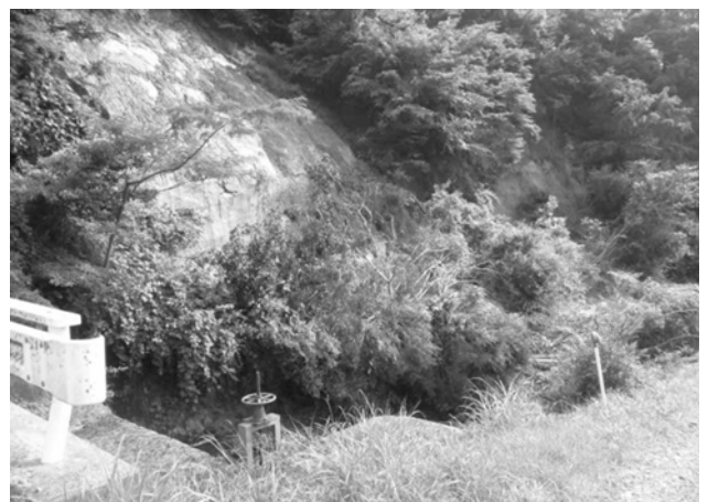
▲台風6号の影響で、熊野地先で山の一部分が崩壊し、日野川に流れ込みました

これまでに全戸配布しました「地震防災マップ」や「洪水ハザードマップ」を活用し、家族や地域で話し合い、いざというとき、どのような行動をとればよいのか確認しておきましょう。