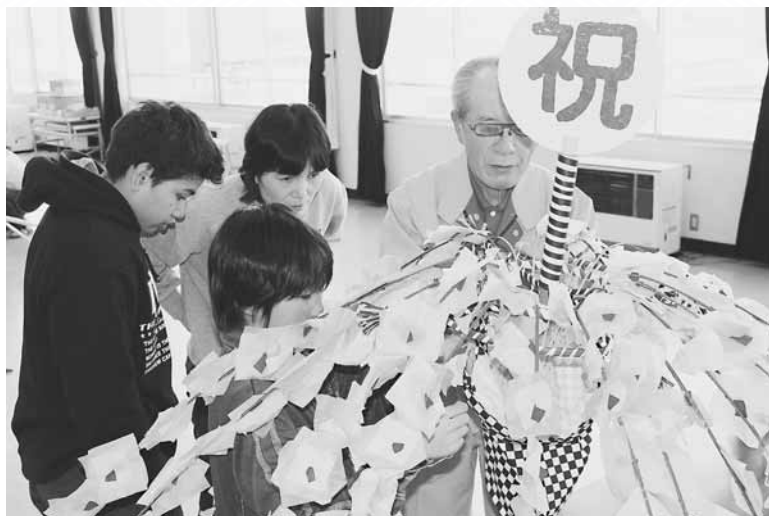
▲本体への組み込み作業で最終仕上げ【3月16日】