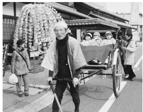
▲あおぞら園の子どもたちも人力車に乗って満喫