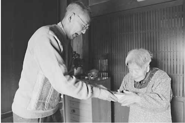
▲民生委員児童委員さんが、一軒ずつ手渡しておはぎを届けられました

2月22日(水)、日野町民生委員児童委員の皆さんが、「しあわせのおはぎ」を作り、70歳以上の一人暮らしの方に届けられました。