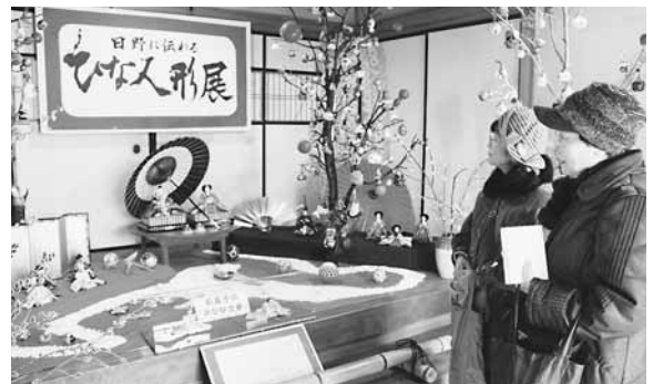
▲俳句を作るため近江日野商人館を訪れる観光客。2月27日に開催された俳句会には全国から約80人が参加