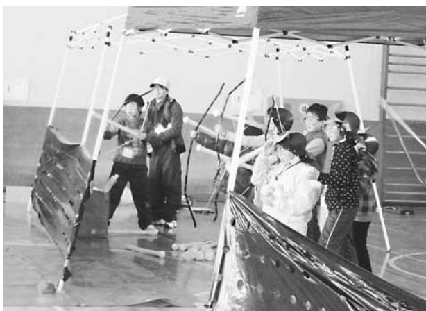
▲模擬の弓矢やつぶて(球)を使って戦を体験する子どもたち

子どもたちは安全な模擬弓矢やつぶて(石)代わりの球を使い、「大手の戦い」「城内乱戦」「天守決戦」の各ステージで、遊びを通して戦を体験し、歴史に触れる機会となりました。