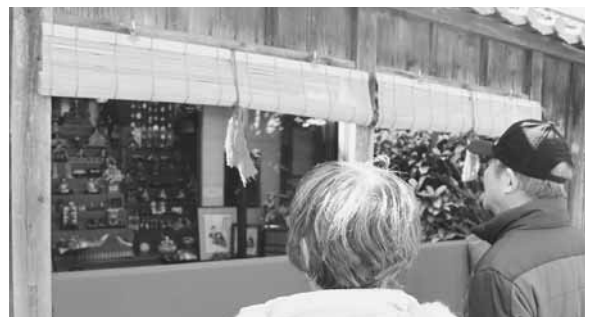
▲ひな人形を棧敷窓から眺められるのは日野ならではの