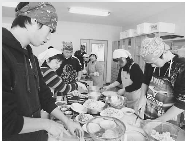
▲健康推進員さんに教わりながら、料理をする高校生たち

2月18日(土)、日野公民館で、日野地区健康推進員さんによる「高校生の料理教室」が行われ、14名が参加されました。