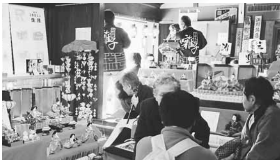
▲「ひなまつり」当日の3日(土)には、多くの観光客が訪れました(日野まちかど感応館)