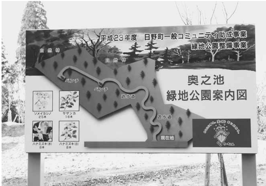
▲公園の入り口に造られた看板