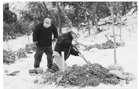
▲地元の方による植樹

コミュニティ助成事業（宝くじ助成）の申請には、「まちづくり計画書」の添付が必須となります。その計画策定については、『日野町元気ある地域活動推進事業』の活用を推奨しています。