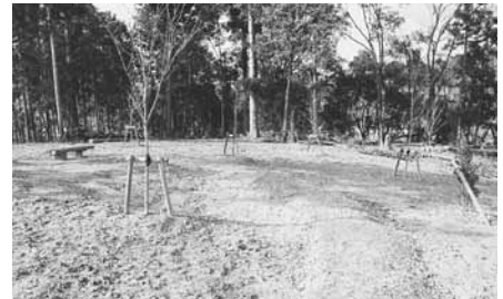
▲完成した遊歩道とベンチ