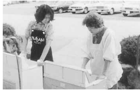
▲りんを含まない石けんの使い方を教えている主婦

そこで、今一度、「琵琶湖を守り、美しい琵琶湖を次代に引き継ぐ」ために制定された、この琵琶湖条例の趣旨について考えていただき、「りんを含む家庭用合成洗剤」（表示成分に『りん酸塩』と記載）を使用されないよう改めてお願いします。