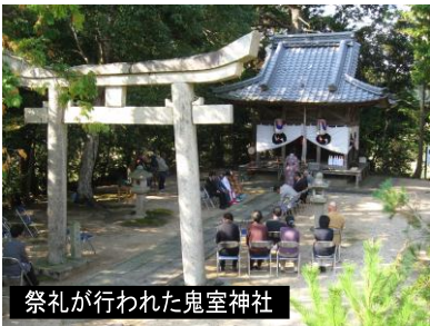
祭礼が行われた鬼室神社

平成21年に整備された韓国風東屋「集斯亭」が建てられた国際交流広場で、小野地区村づくり委員会の方々により恒例のキムチ鍋が準備されました。