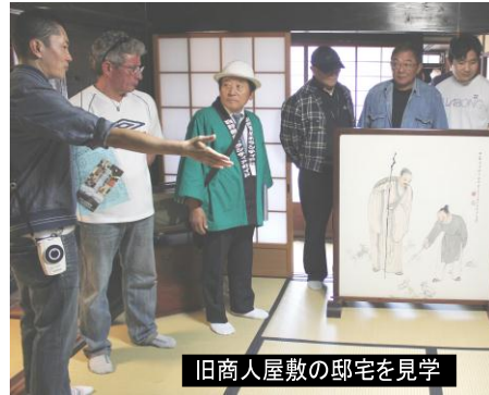
旧商人屋敷の邸宅を見学

加し、日野の歴史文化に触れる催しとして今回初めての開催となりました。当日は中国籍10人と、ブラジル籍8人の18人が参加。