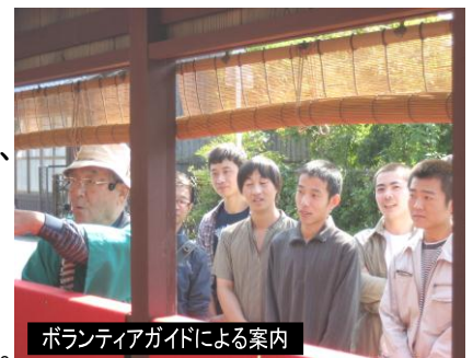
ボランティアガイドによる案内

日野町には4月現在で中国、ブラジルをはじめ17カ国、423人の外国籍の方がお住まいで、言葉や文化の違いを超えて対等な関係を築こうとしながら、共に生きていく地域づくりが求められており、その取り組みが広がっています。