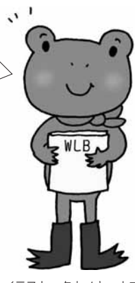
イラスト タカノキョウコ

県では、「仕事と生活の調和推進会議しが」を立ち上げ、仕事と生活の調和（ワーク・ライフ・バランス）が実現した社会づくりに向けて、協力して取り組んでいきます。社会全体で取り組む気運を高めるため、平成24年度から11月を「仕事と生活の調和推進月間」と定め、個人、家庭、事業所、地域等における実践を呼びかけます。期間中に、個人の働き方やライフスタイル、職場環境の見直しなどに、ぜひ取り組んでください。