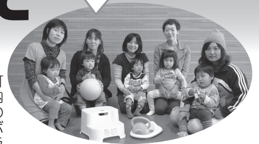
▲ゆめっこMAMAの皆さん