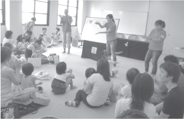
▲たくさんの家族が集まった「ちびっこまつり」

町内には、子育て中の親子と関わっていただいているボランティアの方が、たくさんおられるのを存じていますか？ 遊びの広場の開催や布おもちゃ作り、地域での見守りなどさまざまな形で子育てを応援していただいております。そんな中、子育て中のママたちも、町の子どもたちのためにと頑張っています。