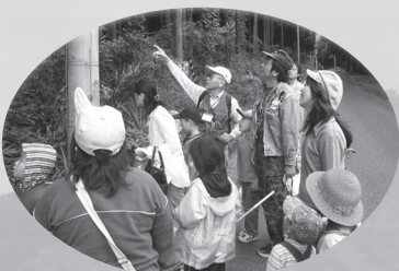
▲平成20年に行われた「みんなで自然観察会」