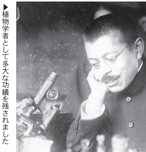
▶植物学者として多大な功績を残されました

普段なにげなく見ている草木も実はとても珍しいものかも知れません。皆さんも一度、いつもと少し違う視点で植物を見てみませんか。