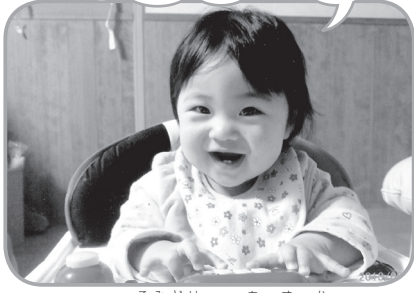
湖南サンライズ こみどり あすか 小緑 明日香 ちゃん (H24. 4. 2 生)