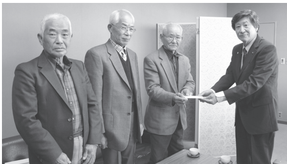
▲協議会役員の方から、思いのこもった寄付金を副町長に手渡していただきました