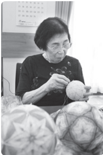
▲1針1針丁寧に縫われていきます