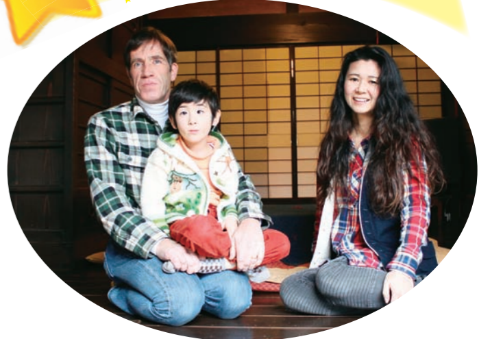
大窪在住 モーアさん ご家族【平成15年移住】