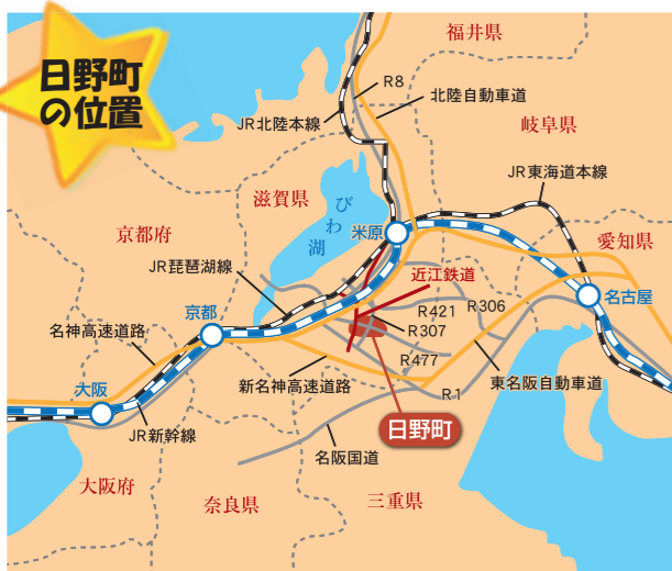
日野町は、滋賀県の南東、鈴鹿山系の西麓に位置する人口約22,200人(平成27年3月1日現在)の町です。