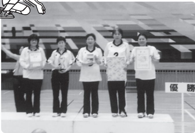
▲大会当日の表彰式にて