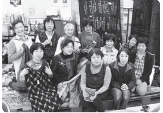
▲仲良く活動しています

着物リメイク工房ひのきは、まちづくりに貢献し、交流を目指す「ひのきの会」から、着物のリメイク等をした人たちが中心となって3年前に発足されました。