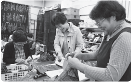
▲おしゃべりしながら楽しく

●まちのイベントへの参加 毎年まちなかで開催される日野ひなまつり紀行ではお雛様、日野祭ではこいのぼり等、町のイベントや行事の時にはお店を開かれ、季節に合ったリメイク品を作っておられます。