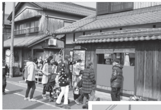
▲たくさんの人でまちはにぎわいました

2月14日(日)から3月13日(日)の1か月間、大窪から西大路一帯で日野ひなまつり紀行が開催されました。特に多くのイベントが開催された2月27日、28日と3月5日、6日は町内外から多くの観光客が訪れました。 会場となった一帯では人力車が走り、落語の寄席やフォークソングコンサート、日野祭囃子の演奏等さまざまなイベントが行われました。 まちかど感応館ではしゃくなげ大使らがお雛さまになって、各家庭や街角に飾られた雛人形とともに観光客を出迎えています。