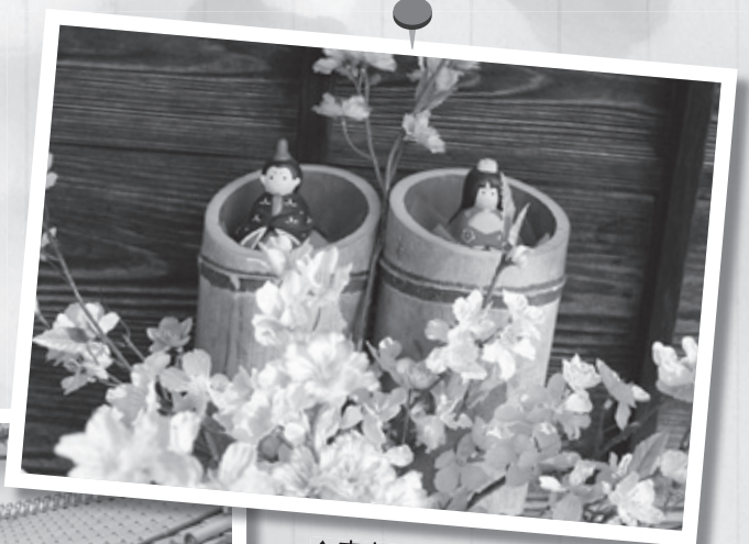
▲まちなかのいろいろなところでお雛さまがお出迎え