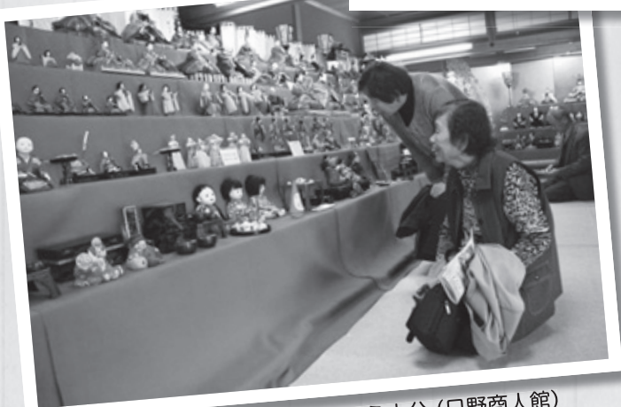
▲ずらりと並んだお雛さまは見てたえ十分(日野商人館)