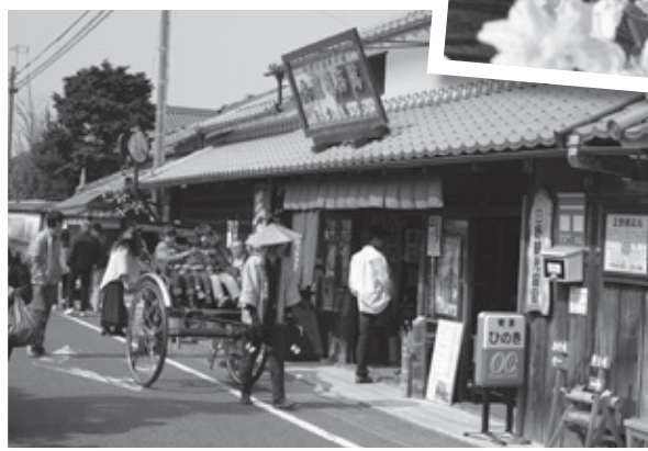
◀人力車に乗ってまちなかを散策