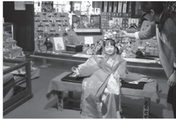
▲お雛さまに変身(まちかど感応館)

2月14日(日)から3月13日(日)の1か月間、大窪から西大路一帯で日野ひなまつり紀行が開催されました。特に多くのイベントが開催された2月27日、28日と3月5日、6日は町内外から多くの観光客が訪れました。 会場となった一帯では人力車が走り、落語の寄席やフォークソングコンサート、日野祭囃子の演奏等さまざまなイベントが行われました。 まちかど感応館ではしゃくなげ大使らがお雛さまになって、各家庭や街角に飾られた雛人形とともに観光客を出迎えています。