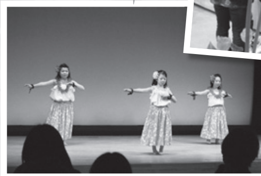
◀フラダンスは平成27年度に初めて開講されました

2月27日(土)、わたむきホール虹で日野町少年少女カルチャー教室THE発表会が行われました。 平成27年度は茶道やいけばな、日本舞踊等8教室が開かれ、94名の子ども達が参加しました。1年間学び、練習してきた成果を展示やステージで披露されました。 参加した子ども達に感想を聞くと、「初めは難しかったけれど、慣れてくれば楽しくなった。来年も続けたい」や「違う学校や学年に友だちができて嬉しかった」と話してくれました。