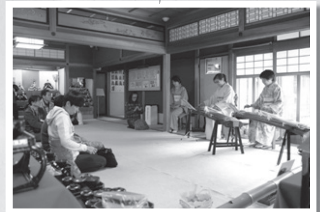
▲琴の音色と一緒に雛さま観賞(日野商人館)