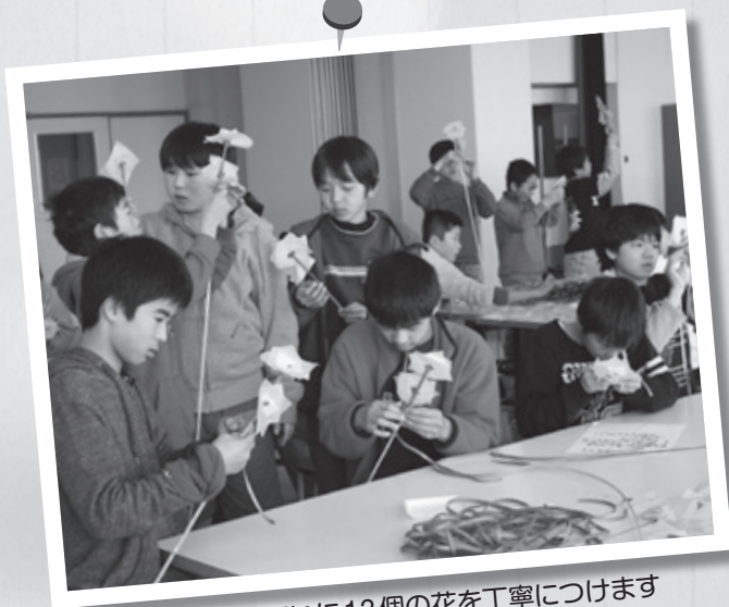
▲1.5メートルのほいに13個の花を丁寧につけます