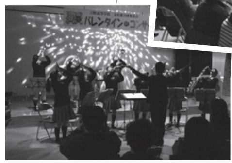
◀練習の成果を発揮しました

2月13日(土)、必佐公民館で日野高校文化部合同発表会「バレンタインコンサート」が行われました。この発表会は9年前から日野高校の音楽室で行われていましたが、昨年からは場所を必佐公民館に移し、今年も保護者の方や友だちなどでホールはいっぱいになりました。音楽部の発表は語りや振り付け等を交えたミュージカル形式で行われ、第3部の吹奏楽部企画ステージではスライドを使うなど工夫を凝らした発表となりました。