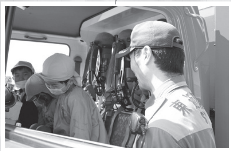
▲初めて乗る車両に興味津々の園児