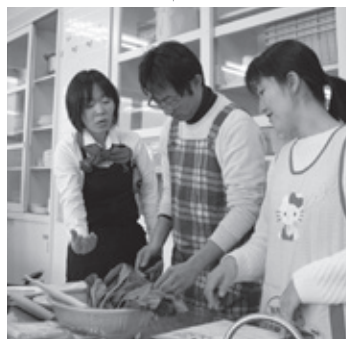
みんなでおいしく 食べました▶