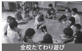
全校たてわり遊び

人の気持ちを思いやり、人権意識を高め、いじめや差別を許さない学級、学校集団、自尊感情の高い子に育てます。