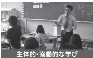
主体的・協働的な学び

学習の基本や規律をしっかり教え、意欲を持って仲間とともに学び、基礎・基本を身に付けられるような学習を展開します。