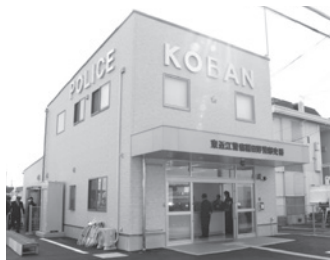
新住所:日野町松尾五丁目15番地

建物は来訪者向けのトイレを設け、入り口の段差をなくす等バリアフリーに配慮した構造