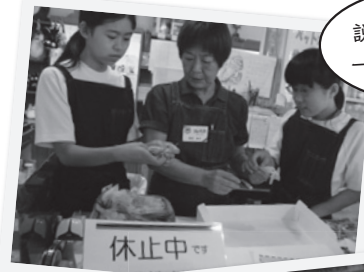
説明を聞きながら一生懸命に作業!

ブルーメの丘では、10名の中学生が体験に来ていました。職員の方々に生徒の印象を聞いたところ、「明るくて元気」「あいさつがしっかりできていて良い」とおっしゃっていました。またこの仕事で大切なことを聞くと「明るく笑顔でお客様に失礼のないよう接客をするのが大切」とおっしゃっていました。