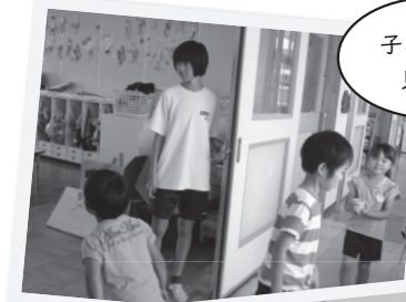
子ども達を見守る

日野幼稚園には5名の生徒が職場体験に来ていました。先生方にこの仕事で大切な事を聞くと、「仕事の大変さや楽しさ、笑顔であいさつをハキハキすることを学んでほしい」とおっしゃっていました。