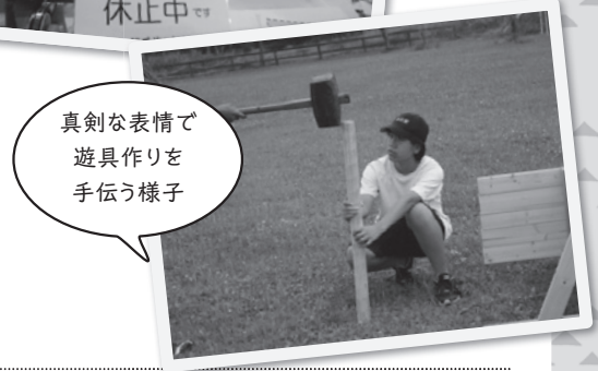
真剣な表情で遊具作りを手伝う様子