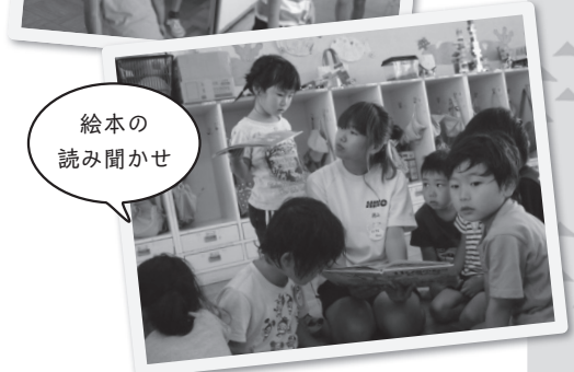
絵本の読み聞かせ