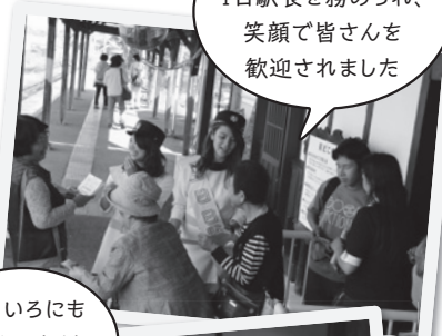
しゃくなげ大使が1日駅長を務められ、笑顔で皆さんを歓迎されました

天候にも恵まれ、町内外から訪れた多くの方でにぎわう中、新たな日野駅の歴史がスタートしました。