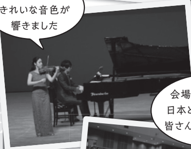
ホールいっぱいにきれいな音色が響きました