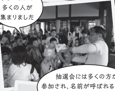
なないろにも多くの方が集まりました