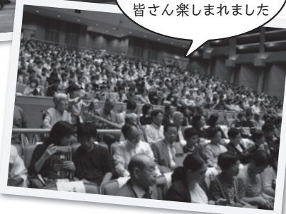
会場は満員となり、日本と西欧の文化を皆さん楽しめました