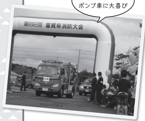
子ども達は多くのポンプ車に大喜び

役場周辺で行なわれた車両パレードには、多くの住民の皆さんも駆けつけ、見学されていました。