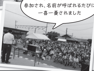
抽選会には多くの方が参加され、名前が呼ばれるたびに一喜一憂されました