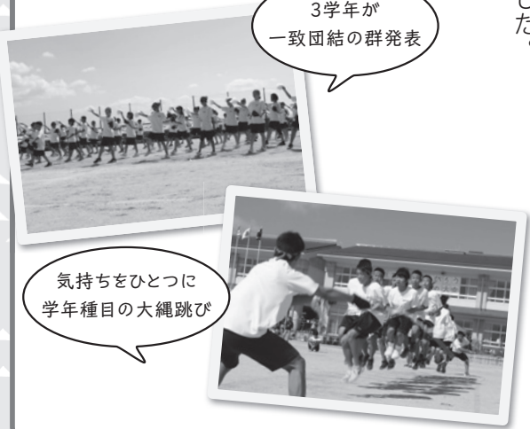
気持ちをひとつに学年種目の大縄跳び