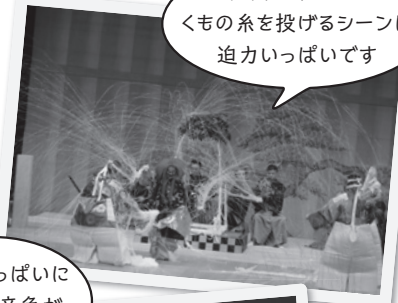
和紙で作られたくもの糸を投げるシーンは迫力いっぱいです

ヴァイオリンリサイタルでは演奏される前に、どのような情景や思いを描いた曲なのか説明があり、その情景や気持ちを思い浮かべながら、皆さん美しい音色に聞き入っておられました。