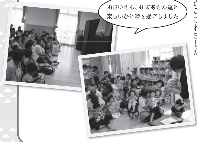
おじいさん、おばあさん達と楽しいひと時を過ごしました

各クラスでも手遊びや絵本の読み聞かせをされ、ゆったりとした温かい時間を過ごされました。