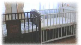
ベビーベッドもあります