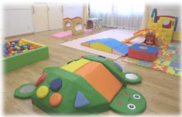
トンネルやすべり台、ボールプールなど「運動あそびコーナー」