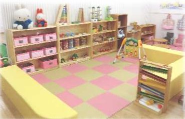
おもちゃがいっぱい「赤ちゃんコーナー」