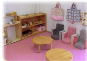
みんな大好き「ままごとコーナー」