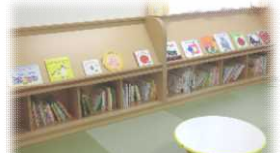
和室でほっこり「絵本コーナー」