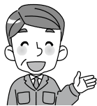
人権擁護委員さん (敬称略)

日野町では5人の人権擁護委員さんが、 小学校で子ども達を対象に人権教室を開催 するなど、様々な啓発活動やよろず相談(月 1回)等で 相談を受け ておられま す。相談に 関する秘密 は厳守され ます。