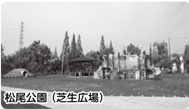
松尾公園 (芝生広場)