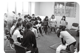
救急救命法を学ぶ

SSWやSCを配置し、教育相談体制の充実に図り、安心な学校・園・地域をつくれます。また、自然災害や事件・事故の被害にあわないよう、地域と連携した見守り体制の整備を推進します。通学路の安全確認とともに交通安全教室の実施などにより、安全な環境づくりを進めます。