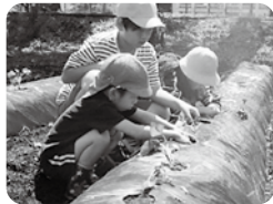
小学生と園児との交流