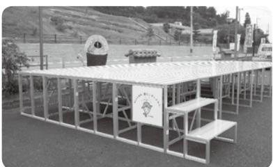
▲アルミステージは、納涼祭などのイベントでも活用されます。

今回整備されたアルミステージがさまざまなイベント等に活用され、一層のコミュニティ活動の充実が図られることを期待します。