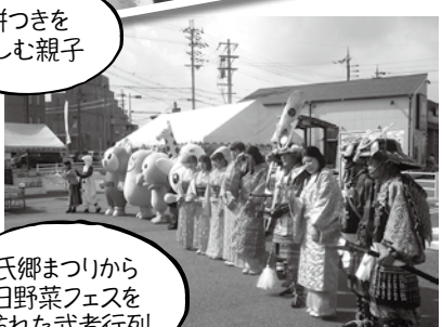
氏郷まつりから日野菜フェスを訪れた武者行列