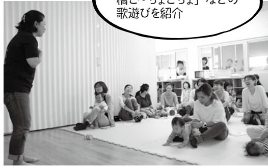
「ラララ♪ぞうきん」「一本橋こ～ちょこちよ」などの歌遊びを紹介

参加された方は「目からウロコなことばかりで、すごく子育てに役立ちました。普段のイライラ解消の仕方も教えていた