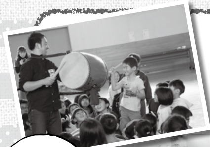
音楽に合わせて太鼓を叩きました