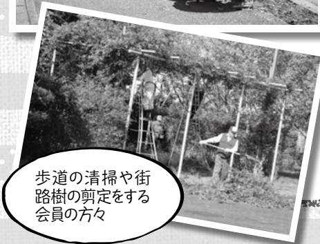
歩道の清掃や街路樹の剪定をする会員の方々