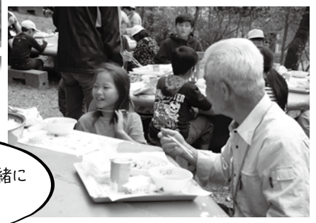
地域の方と一緒に食べました