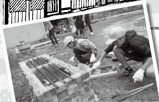
かまどベンチで味噌汁作り

森のレストランでは、自分達が育てた米やサツマイモを使った具だくさんの炊き込みご飯や味噌汁がふるまわれました。1・2年生は収穫したサツマイモを洗い、3・4年生は招待状を地域の方へ送り、5・6年生はかまどベンチで火を起こし味噌汁を作りました。招待された方は「子ども達といっぱいおしゃべりできて、給食もおいしくしゃかったです」と話してくださいました。