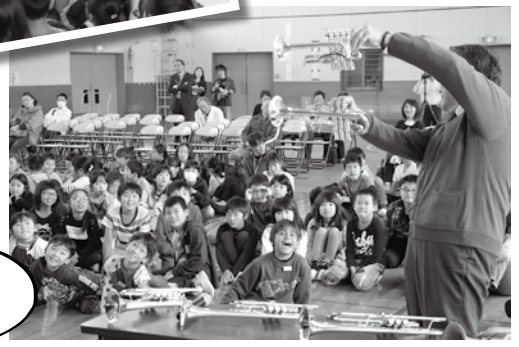
先生方による楽器紹介