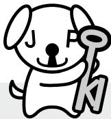
公的個人認証 サービスPRキャラクター マイキーくん