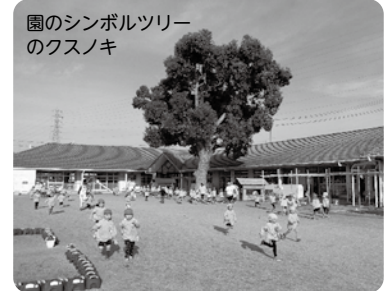
園のシンボルツリーのクスノキ

天気の良い日はどの学年も元気に園庭でいっぱい体を動かして遊んでいます。朝には体操とジョギングもしています。