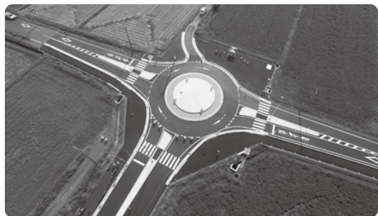
ラウンドアバウト航空写真