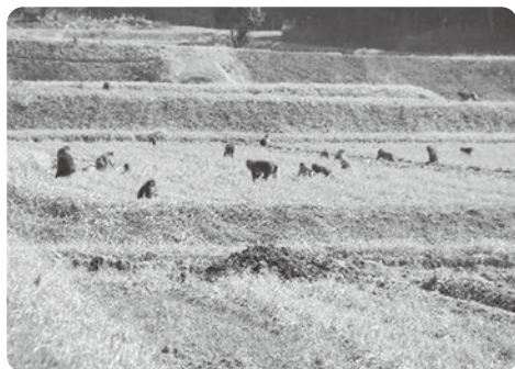
水稲の落穂に群がるニホンザル

水稲収穫後の落穂、ひこばえ（2番穂）、収穫漏れの大豆、収穫後のイモのつる、放置された野菜くず、柿・栗など