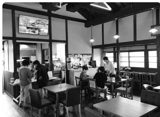
▲日野駅観光案内交流施設「なないろ」でほっと一息