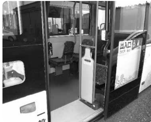
▲ノンステップバスの乗降口

近江鉄道バスでは、JRとの乗り継ぎ等の利便性の向上とキャッシュレス化を図るため、3月27日(土)から交通系ICカード(ICOCA)の利用を開始されます。また、ICOCA定期券やポイントサービスも新たに始まります。