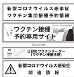
町のホームページ