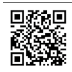
まちづくりネット 鎌掛Instagram

遊学広場「地域で遊ぶ地域で学ぶ交流広場」、空き家対策に関するタウンミーティングについては、どなたでも参加できます。詳しくは左の2次元コードからご確認ください。