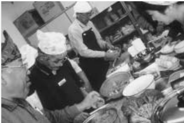
▶みんなで楽しく調理されました