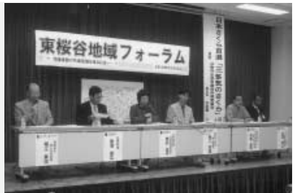
▶団体の代表者による意見交換

参加者は、子どもの健やかな成長に「食」がいかに大切かを改めて考える機会になったのではないのでしょうか。