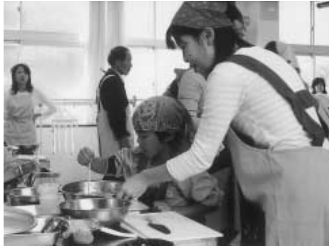
▲お母さん、お父さんと一緒に作ったよ!

11月6日(月)、必佐小学校の調理室において、必佐幼稚園5歳児の親子を対象に「親子クッキング教室」が開催され、38名が参加されました。これは、親子で食の大切さを学んでもらおうと保健センターが主催したものです。