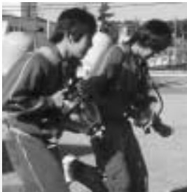
約8kgの空気呼吸器を背負って走っている様子です。 ▼▶

消防署には8人の男子生徒が体験に行きました。 川から水を引いて放水訓練をしたり、約8kgもある空気呼吸器を背負って走るなどの、消防訓練が行われました。 ロープを使った訓練は、7mの高さから壁をつたって下り下りするというとても恐いものでした。