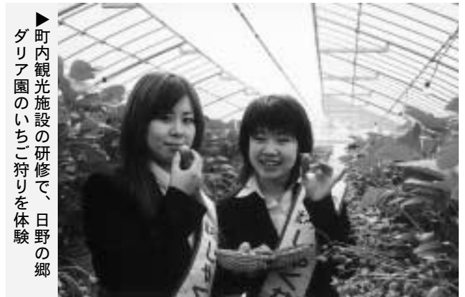
▶町内観光施設の研修で、日野の郷ダリア園のいちご狩りを体験