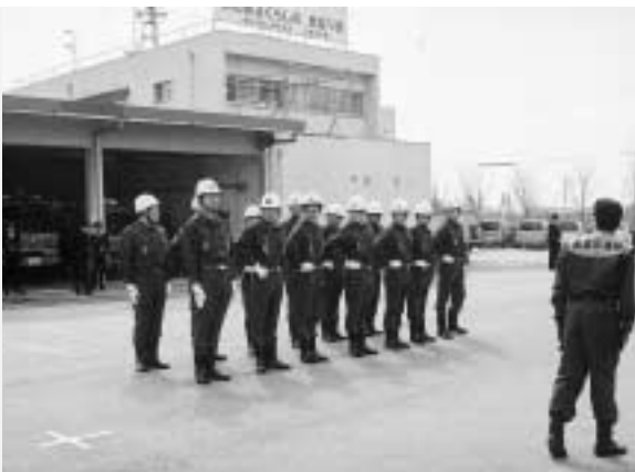
▶元気よくきびきびと訓練に取り組まれました

式典の後、新入団員および昇任班長の皆さんは日野消防署でホース延長などの基礎訓練を受けられました。消防団員の皆さんには、いつ起こり得るかも知れない災害から、地域住民の命や暮らしを守るために、昼夜問わずご活躍いただきます。