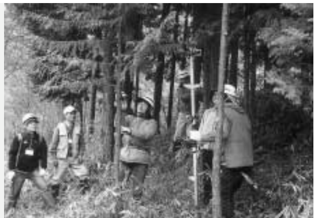
▶木の枝打ち・間伐に挑戦!