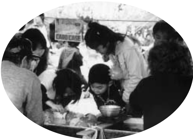
▲出店も並び、子どもたちでにぎわっていました