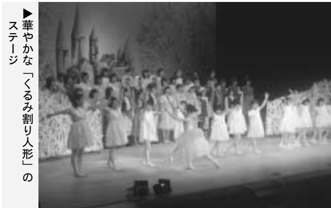
▶華やかな「くるみ割り人形」のステージ