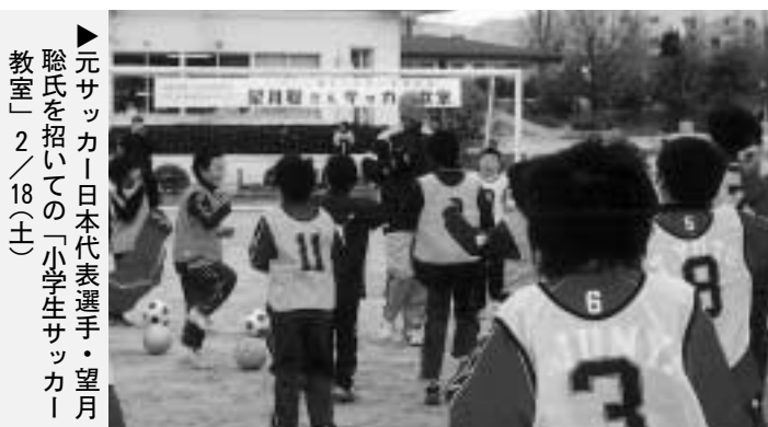
▶元サッカー日本代表選手・望月聡氏を招いての「小学生サッカー教室」2/18(土)

▶右のグラフ：平成17年1月に日野町教育委員会が20歳以上の町民2,000人を対象に実施した『人権学習に関する意識調査』より、「問い：時間的余裕があれば、学習したり習ってみたいと思うことはどんなことがありますか。(回答3つまで)」