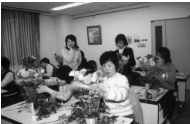
▲虹の文化講座「フレッシュ&プリザーフラワーアレンジメント講座」3/10(金)