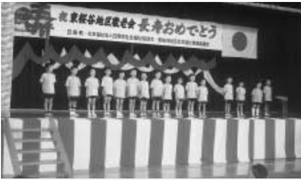
▲昨年の東桜谷地区敬老会

各地区において、敬老会実行委員さんのご協力のもと、敬老の趣旨にふさわしく、趣向を凝らした敬老会が行われます。また、長寿