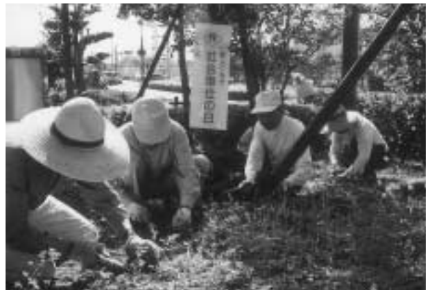
▲老人クラブによる「日野町立介護老人保健施設リスタあすなる」での清掃活動

誰もが「いつまでもいきいきと暮らしていくために、私たちに何ができるのか、この敬老月間を機に、今一度、考えてみましょう。」