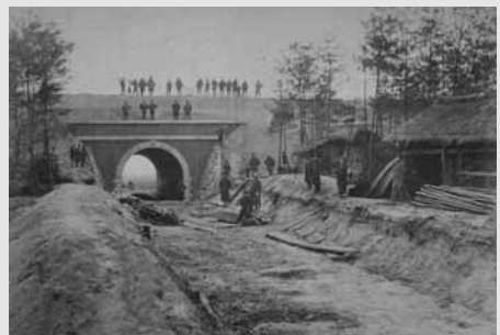
▲関西鉄道家棟川隧道之図

同盟会では、120周年にあわせ、さまざまな記念事業を実施します。皆さんもこの機会に近江鉄道、草津線を利用の上、ぜひ事業にご参加ください。