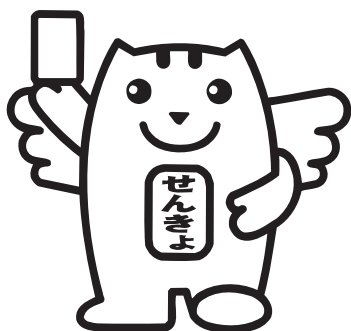
明るい選挙のキャラクター 「めいすいくん」