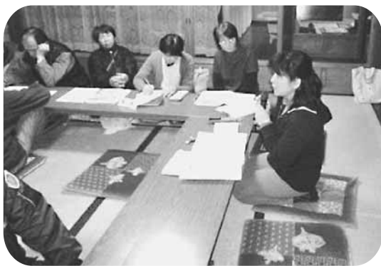
▲地区での学習会の様子

しかし、周囲の理解と気づき、そして地域の支えあいがあれば穏やかに暮らしていくことも可能です。町では各地域や学校で認知症の学習会を開催しています。認知症について考え、支えあいの輪を広げていきましょう。