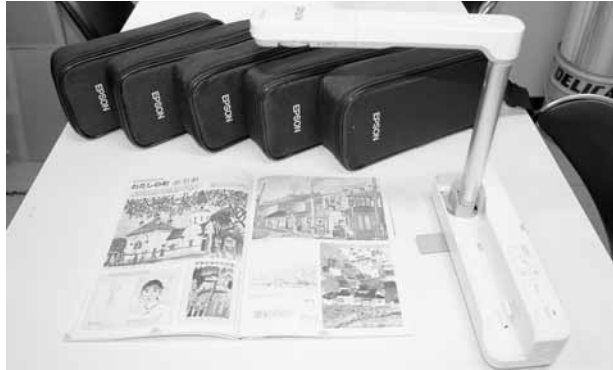
▲寄贈いただいた書画カメラ。教科書や標本等をテレビやプロジェクター等で拡大提示することができます