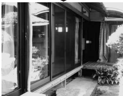
Aさん宅のリフォーム後