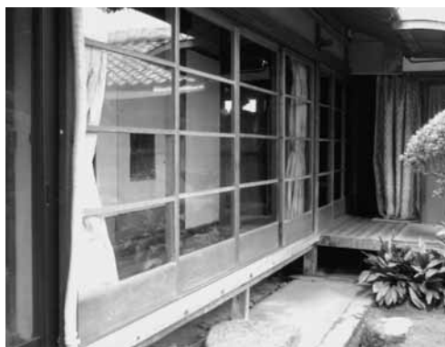
Aさん宅のリフォーム前