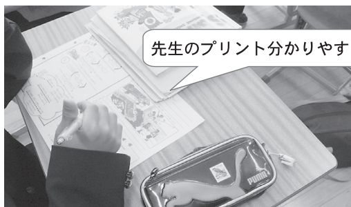
先生のプリント分かりやすい！

中学校では「わかった」「できた」「解けた」など充実あふれる授業が生徒の力を高めます。学習では生徒の理解に応じて教員が作成した自作プリント・ワークブックなどを活用しています。また、授業中の発表や生徒同士の話し合いなども重視しています。さらに体験的な学習として、理科の実験や技術家庭のものづくり等にも力を入れています。