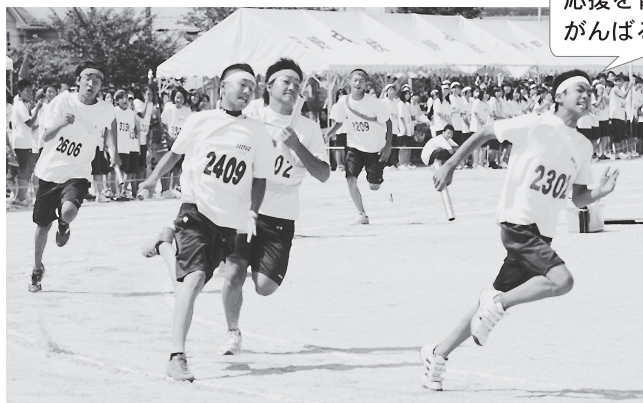
応援を背に がんばるぞ

生徒ががんばる伝統ある合唱コンクール、体育祭は日野中ならではの行事です。生徒は1年生～3年生の学年を超えた縦割り組織「群」を形成し、練習や準備を行います。40年以上にわたって取り組まれているこの行事は生徒・保護者・教員の誇りです。