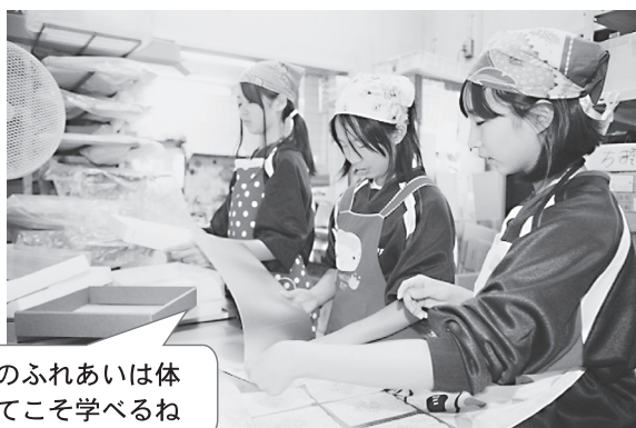
人とのふれあいは体験してこそ学べるね

道徳・人権・平和学習を中心にしながら、豊かな心をはぐくむ学習を実施しています。教室での学習だけでなく、修学旅行、校外学習、職場体験活動、ボランティア活動などで実際の体験も大切にしています。