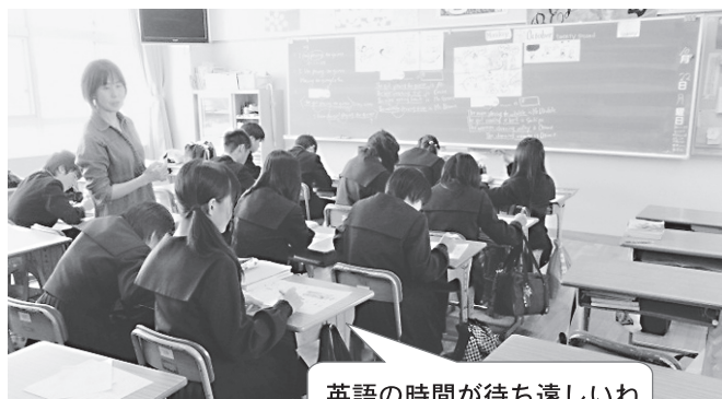
英語の時間が待ち遠しいね

数学では1年生、英語では3年生の全学級を二つのグループに分けて、きめ細かな指導を行っています。英語プロモート事業ではコミュニケーションや言語活動を取り入れた魅力ある内容をめざしてきました。英語の先生と外国語指導助手（ALT）の授業もあり、生徒は楽しみながら自然と英語の力がついていきます。