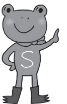
イラスト：タカノキョウコ

「日野町男女共同参画社会づくりに関する町民意識調査」の結果をシリーズでご紹介してきましたが、今回で最終回となります。