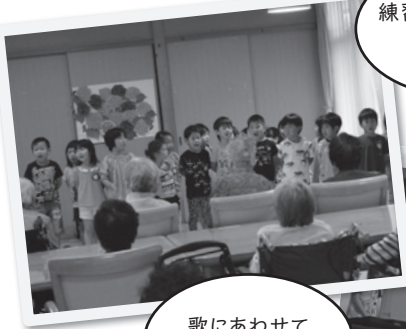
練習した歌を披露しました

手遊びは園児が歌に合わせて利用者の皆さんに肩たたきをしたり、じゃんけんしたり楽しく交流しました。