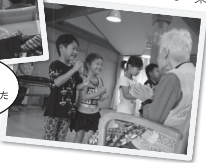
歌にあわせてじゃんけんしました